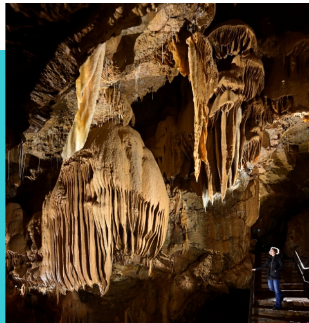
le couloir des merveilles

Commande au 07 87 39 06 24 OU 04 66 85 03 28