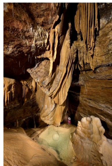
salle du Gong