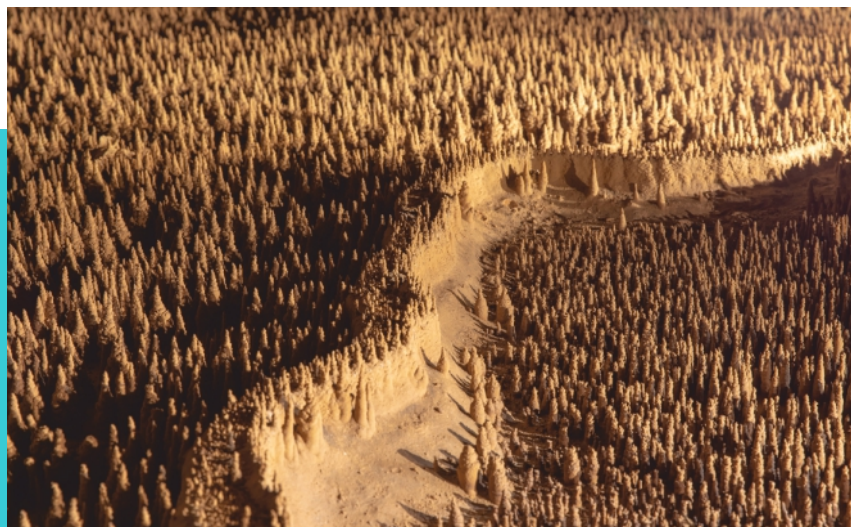
les 100.000 Soldats et la muraille

Faites une excursion guidée, toute en douceur dans notre patrimoine souterrain.