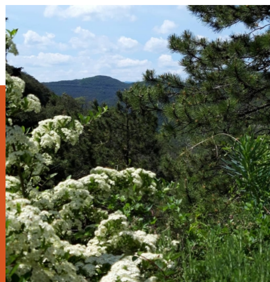
La vallée de Mialet