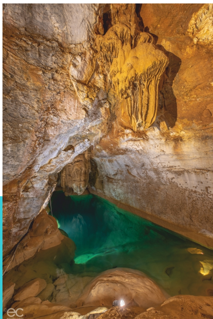
le lac de minuit

Trabuc est une grotte incontournable, à la fois riche en concrétions surprenantes, et mise en valeur par un habillage lumineux interactif sur un parcours bien aménagé, sonorisé et sécurisé.