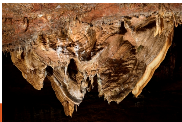
le grand papillon