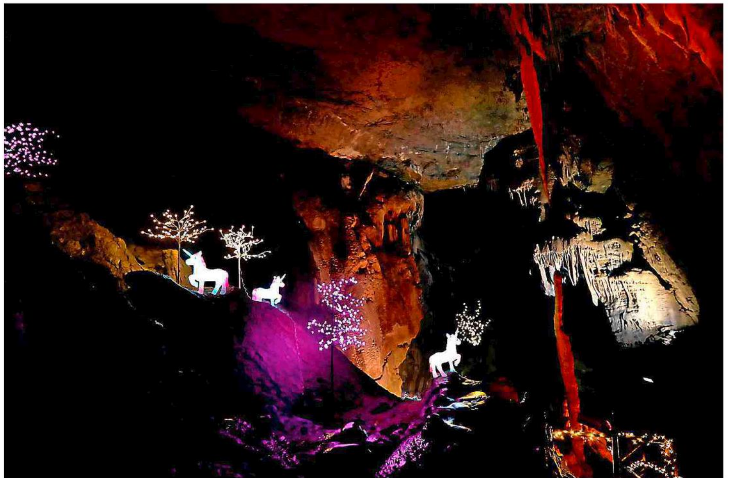
Avec ambiance musicale et cheminement de bougies, la grotte de Trabuc offre, en cette fin d'année, un singulier visage.