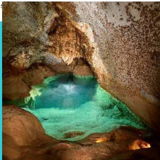
le lac de minuit