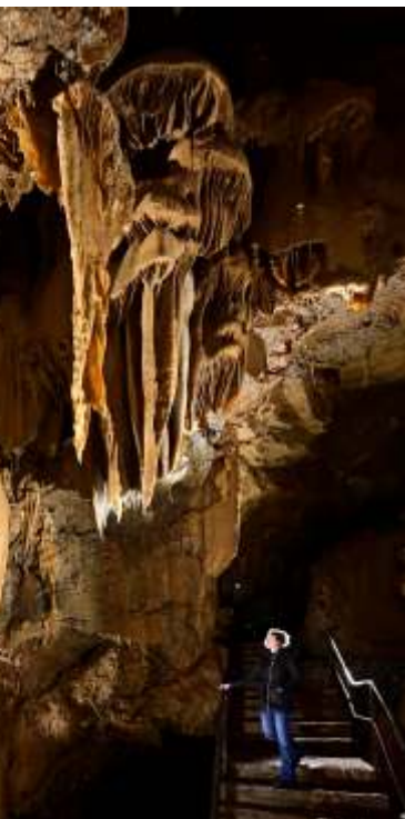
Couloir des Merveilles