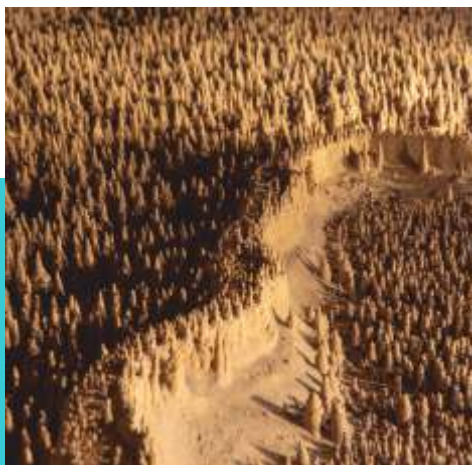
les 100.000 Soldats et la muraille

Faites une excursion guidée, toute en douceur dans notre patrimoine souterrain.