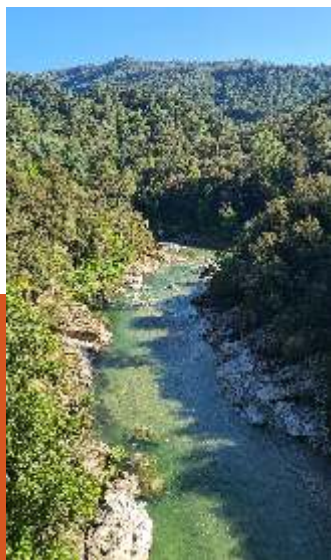
la vallée de Mialet